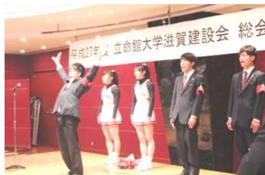
応援団の演舞(元気いただきました)