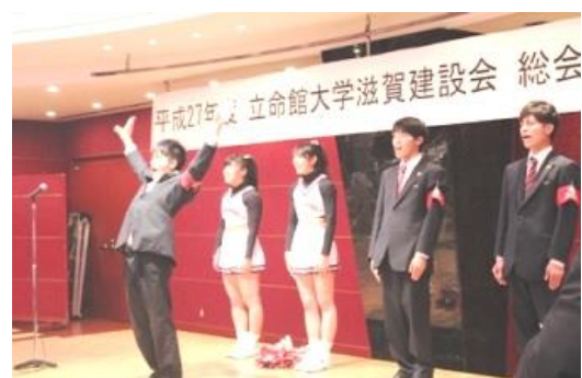
応援団の演舞(元気いただきました) H27

《 ↑ 滋賀建設会のホームページ( http://www.biwako.ne.jp/~kinugasa/ )から》