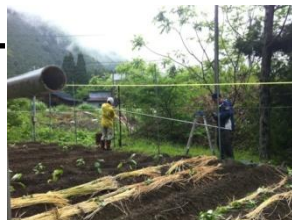
Zuttoの畑が広がりました！！