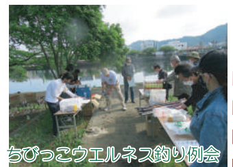
ちびっこウェルネス釣り例会