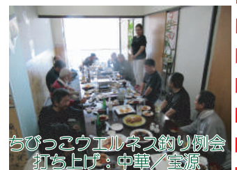
ちびっこウェルネス釣り例会 打ち上げ：中華・壺源