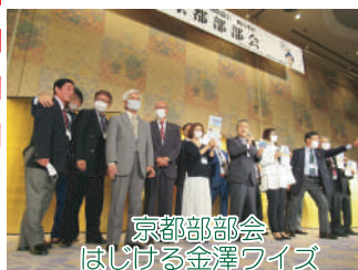
京都部部会 はしける金澤ワイズ