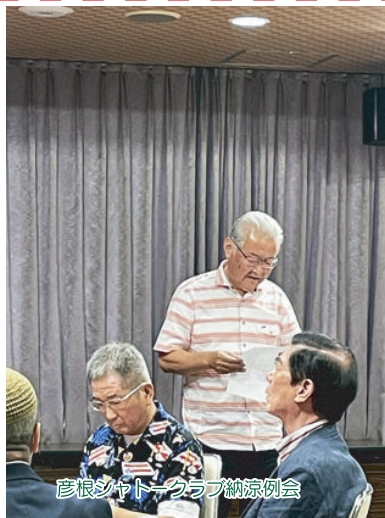
彦根シャトークラブ納涼例会