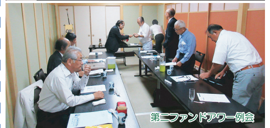
第二ファンドアワー例会