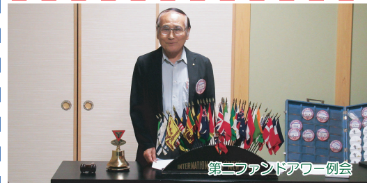
第二ファンドアワー例会